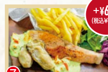
⑦ 牡蠣とサーモンのムニエル