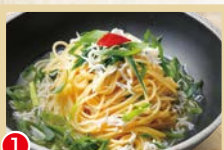
① シラスと九条ネギの ペペロンチーノパスタ