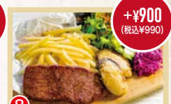
⑧ 牛肉と牡蠣のステーキランチ