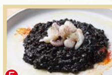
⑤ イカ墨のリゾット