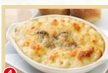
④ 牡蠣とチーズの クリームグラタン