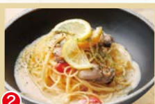
② 牡蠣のレモンクリームソース パスタ