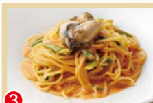
③ 牡蠣とほうれん草の オマールクリームソースパスタ