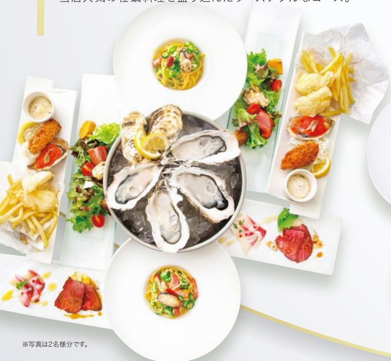
※写真は2名様分です。