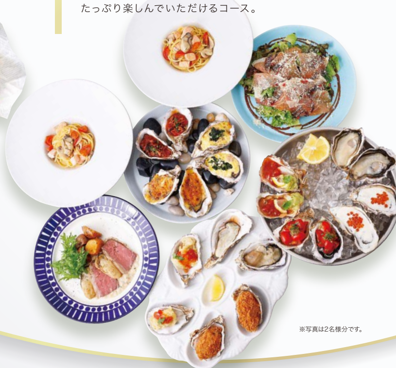
※写真は2名様分です。