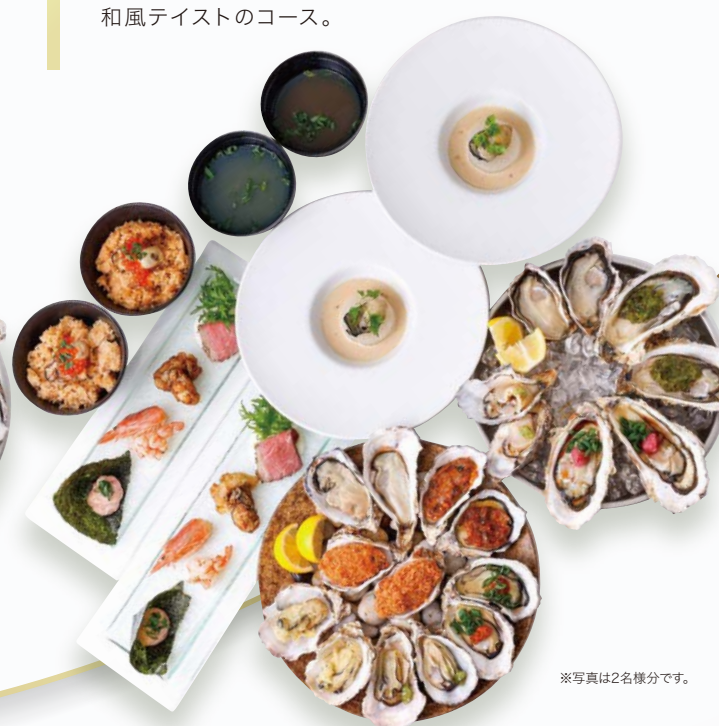
※写真は2名様分です。