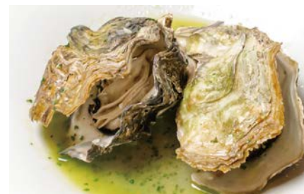
牡蠣の香草バター蒸し

ニンニクで香りをつけたオイルに生牡蠣を入れてワイン蒸しにし、香草バターで仕上げました。