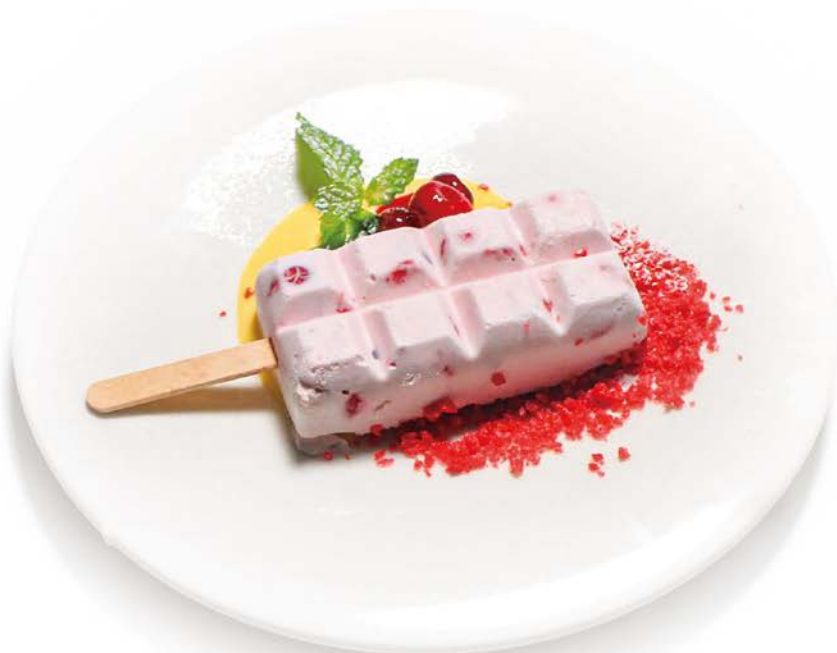
Strawberry Cassata with Berry Sauce