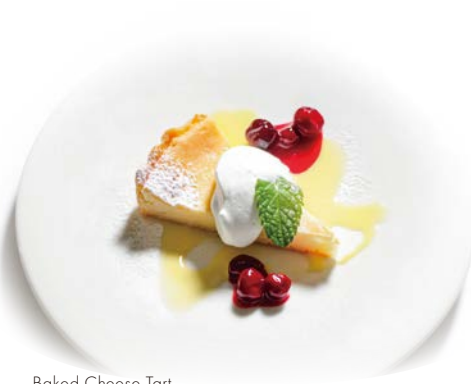
Baked Cheese Tart