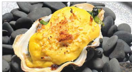
Grilled oysters with Hollandaise Sauce and Spinach~Rockefeller~