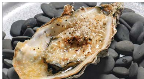
Grilled Oyster with Truffle Sauce and Parmesan Cheese