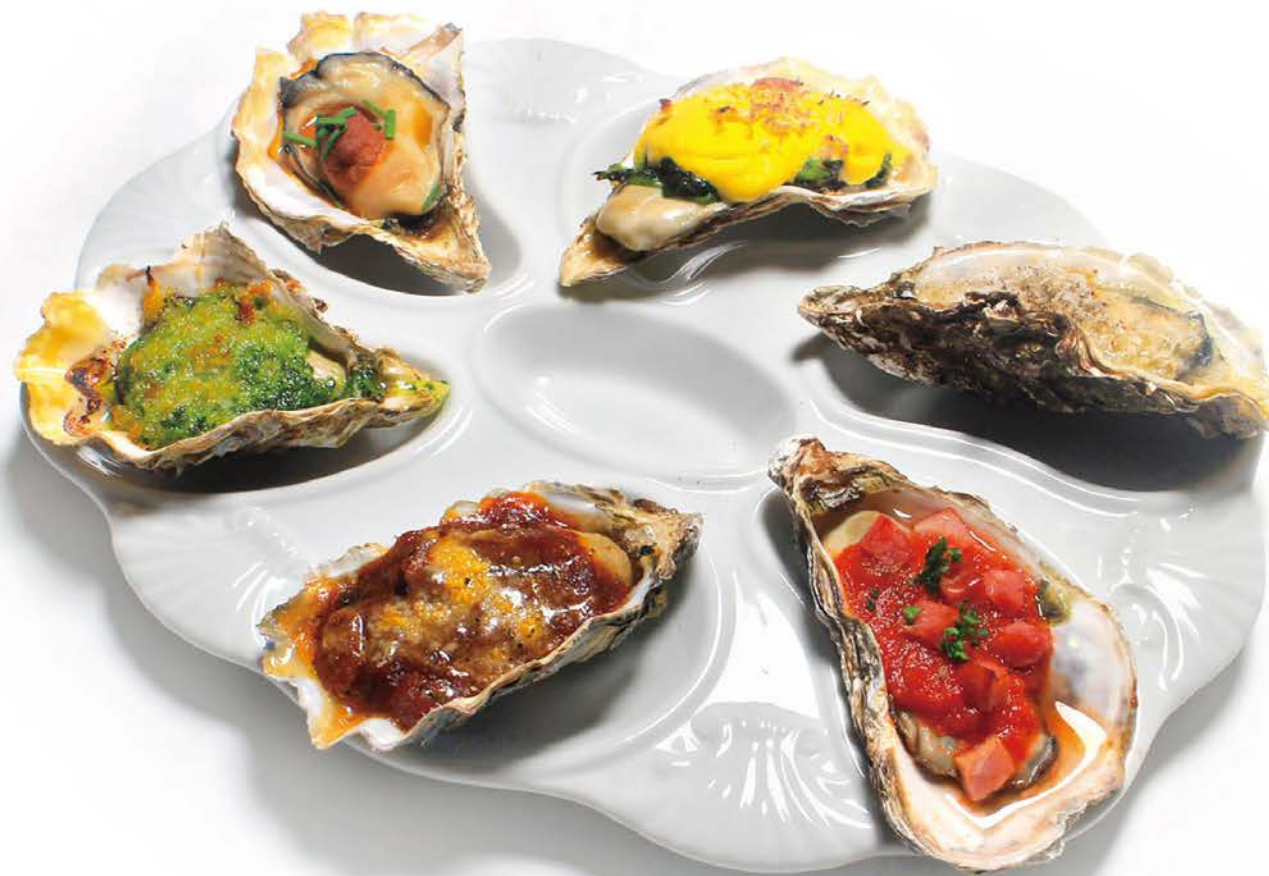
3 Kinds of Assorted Grilled Oyster