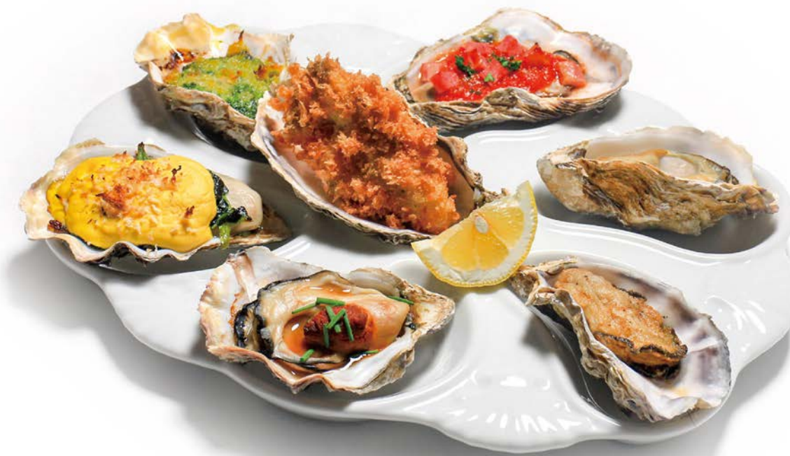
ホットオイスタープレート

焼き牡蠣4種、素焼き、バターソテー、フライを各1ピースずつ盛り合わせたプレートです。