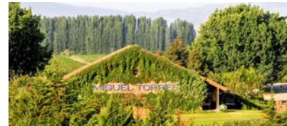
ミゲル・トーレス・チリ

牡蠣に合うワインを追い求め、よりお食事を楽しむ事ができる 当店のオリジナルワイン、『CACCCI(カッキー)』 スペインの名門ミゲル・トーレス・チリ社とのコラボワインです。 牡蠣料理とのマリアージュを是非お楽しみください。