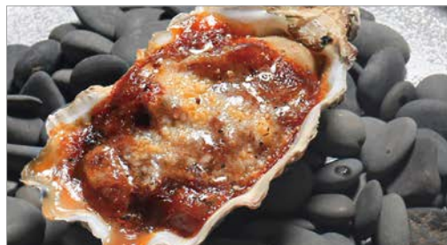
Grilled Oyster with Mushrooms and Demi-glace Sauce