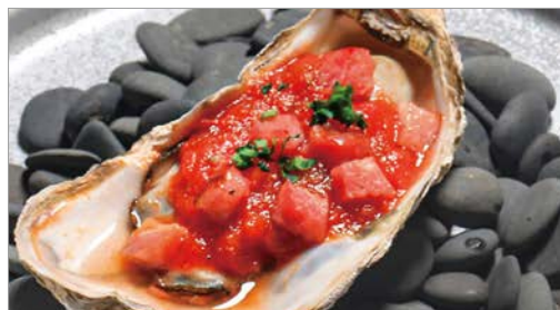
Grilled oysters with Bacon and Smoky Tomato Sauce~Kilpatrick~