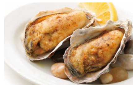
牡蠣のバターソテー

焼くことにより、旨みが凝縮されています。生牡蠣とは違った味わいをお楽しみいただけます。