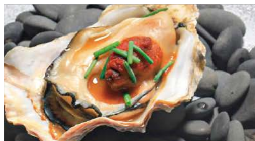
Grilled Oyster with Sea Urchin and Oyster Soy Sauce