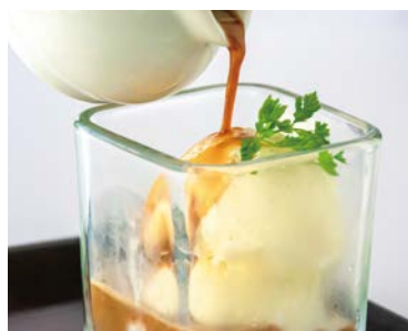
Affogato アフォガード ~エスプレッソ&バニラアイスクリーム~ ¥600(税込¥660)

Today's Ice Cream 本日のアイスクリーム ¥400(税込¥440)