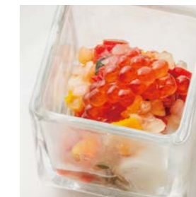
Oyster cubes with Colorful marinated vegetables and salmon roe 彩り野菜マリネとイクラ のオイスターキューブ ¥550(税込¥605)