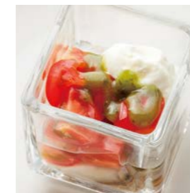
Oyster cubes with mascarpone and basil sauce マスカルポーネとバジルソース のオイスターキューブ ¥550(税込¥605)