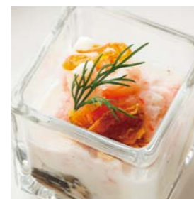
Oyster cubes with red snow crab, shrimp and lemon cream 紅ズワイ蟹とエビ、レモンクリーム のオイスターキューブ ¥550(税込¥605)