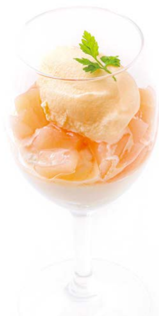
cheese mousse and fruit sauce チーズのムースと 果実のソース ¥680(税込¥748)