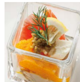
Oyster cubes with smoked salmon and carrot lemon スモークサーモンとキャロットレモン のオイスターキューブ ¥550(税込¥605)