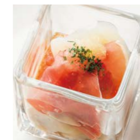
Oyster cubes with Scallops, prosciutto, and apple sauce ホタテと生ハム、リンゴソース のオイスターキューブ ¥550(税込¥605)