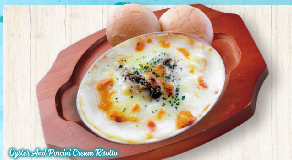
Oyster And Porcini Cream Risotto

牡蠣とポルチーニクリームリゾット 🍴 100g ¥1,280 (税込¥1,408) 150g Ⓢ¥300 (税込¥330)