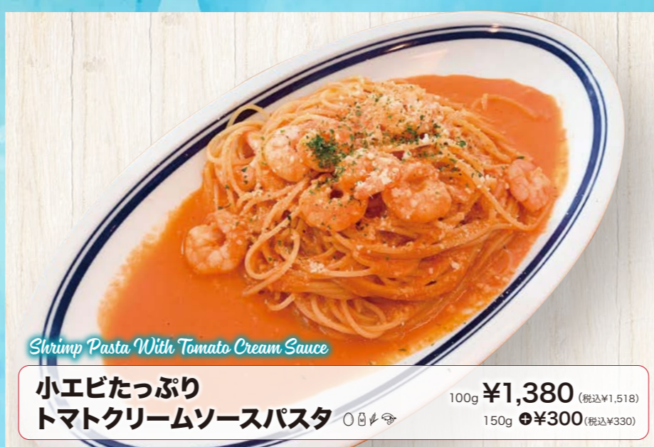
Shrimp Pasta With Tomato Cream Sauce

牡蠣ペンネグラタン 〇🍴🍴 ¥1,280 (税込¥1,480) パン付 ~ホワイトソースとモッツアレラソース~