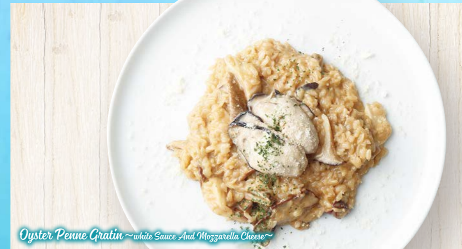
Oyster Penne Gratin ~white Sauce And Mozzarella Cheese~

本日のパスタ 〇🍴🍴 100g ¥1,180 (税込¥1,298) 150g Ⓢ¥300 (税込¥330)