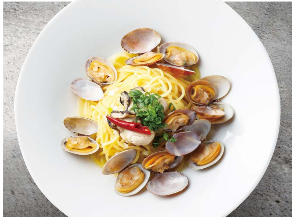
Oyster bar vongole オイスターバーのボンゴレ サラダ / 牡蠣スープ ¥1,280 (税込¥1,408)