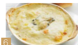
6 牡蠣とチーズのクリームグラタン