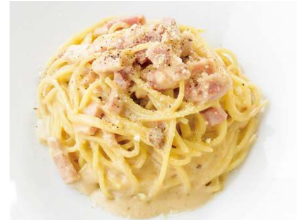
Rich sea urchin and bacon carbonara 濃厚ウニとベーコンのカルボナーラ サラダ / 牡蠣スープ ¥1,280 (税込¥1,408)