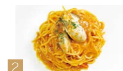
2 牡蠣と蟹味噌のトマトクリームパスタ