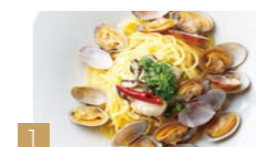
1 オイスターバーのボンゴレ