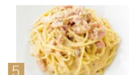
5 濃厚ウニとベーコンのカルボナーラ