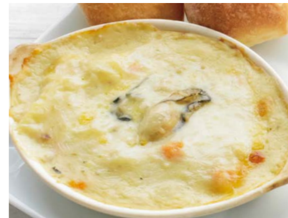
Oyster and cheese cream gratin 牡蠣とチーズのクリームグラタン 牡蠣スープ / パン ¥1,280 (税込¥1,408)