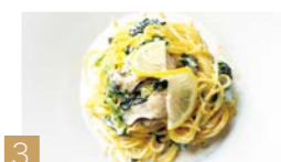
3 牡蠣とホウレン草のレモンクリームパスタ