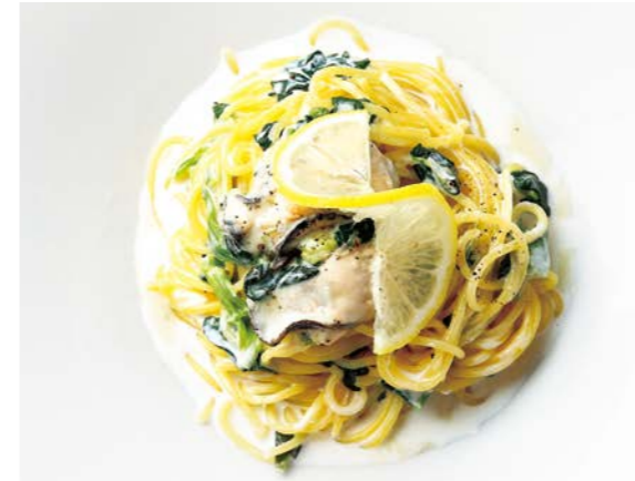
Lemon cream pasta with oysters and spinach 牡蠣とホウレン草のレモンクリームパスタ サラダ / 牡蠣スープ ¥1,280 (税込¥1,408)