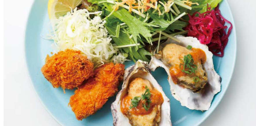
Oysters sautéed in butter with garlic sauce and fried oysters for lunch 牡蠣のバターソテーガーリックソースと カキフライランチ 牡蠣スープ / 十八穀米ごはん or パン2個 付き ¥1,280 (税込¥1,408)