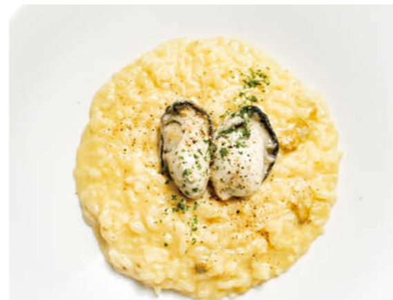
Oyster and sea urchin cream risotto 牡蠣とウニクリームのリゾット サラダ / 牡蠣スープ ¥1,280 (税込¥1,408)