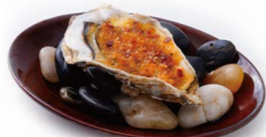
Grilled Oyster with Herbed Garlic Butter ガーリックバターと香草パン粉 の焼き牡蠣 ¥550(税込¥605)