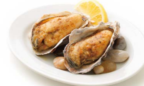
Butter Sauteed Oyster 牡蠣のバターソテー 2ピース¥780(税込¥858)

Hot Oyster Platter 〈 Butter Sauteed Oyster/ Garlic butter Sauce and Herb Bread Crumbs/ Breaded Oyster〉