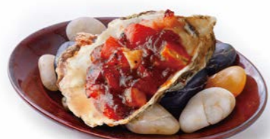
Oyster kilpatrick ~ tomato, bacon, BBQ sauce ~ オイスターキルパトリック ~ トマトとベーコン、BBQソース ~ ¥550(税込¥605)