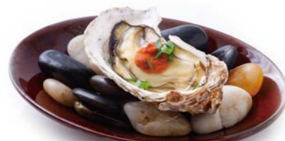
Grilled Oyster with Sea Urchin and Oyster Soy Sauce ウニと牡蠣醤油の焼き牡蠣 ¥550(税込¥605)