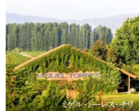
ミゲル・トーレス・チリ

牡蠣に合うワインを追い求め、よりお食事を楽しむ事ができる 当店のオリジナルワイン、「CACCCI(カッキー)」 スペインの名門ミゲル・トーレス・チリ社とのコラボワインです。 牡蠣料理とのマリアージュを 是非お楽しみください。