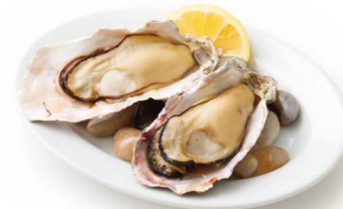
Plain Grilled Oyster 牡蠣の素焼き 2ピース¥720(税込¥792)