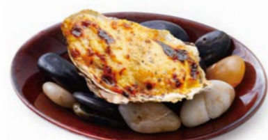
Grilled Oyster with Carbonara style with truffle sauce トリュフソースのカルボナーラ風 焼き牡蠣 ¥550(税込¥605)

3 Kinds of Assorted Grilled Oyster 焼き牡蠣盛り合わせ 3ピース ¥1,540(税込¥1,694) 6種類の中から3種類お選びください。 おすすめ 6ピース ¥3,000(税込¥3,300) 焼き牡蠣6種の 全種類1個ずつの盛り合わせです。