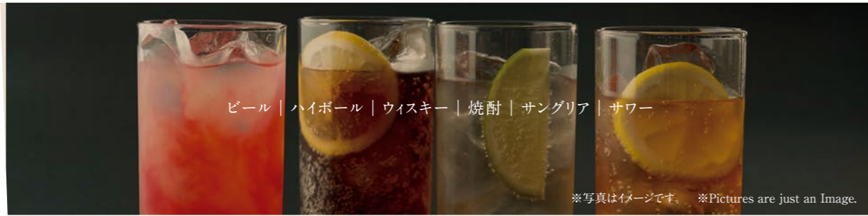
ビール | ハイボール | ウイスキー | 焼酎 | サングリア | サワー

※写真はイメージです。 ※Pictures are just an Image.