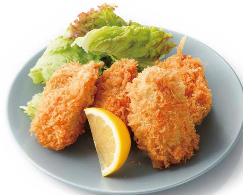
Breaded Oyster カキフライ 2ピース¥720(税込¥792) 3ピース¥1,080(税込¥1,188)