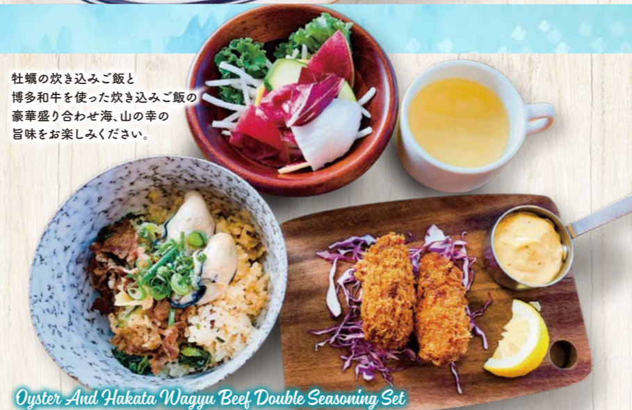
Oyster And Hakata Wagyu Beef Double Seasoning Set

牡蠣スープ / カキフライ 4ピース 牡蠣の炊き込みご飯 ※牡蠣の炊き込みご飯はパンに変更可能です