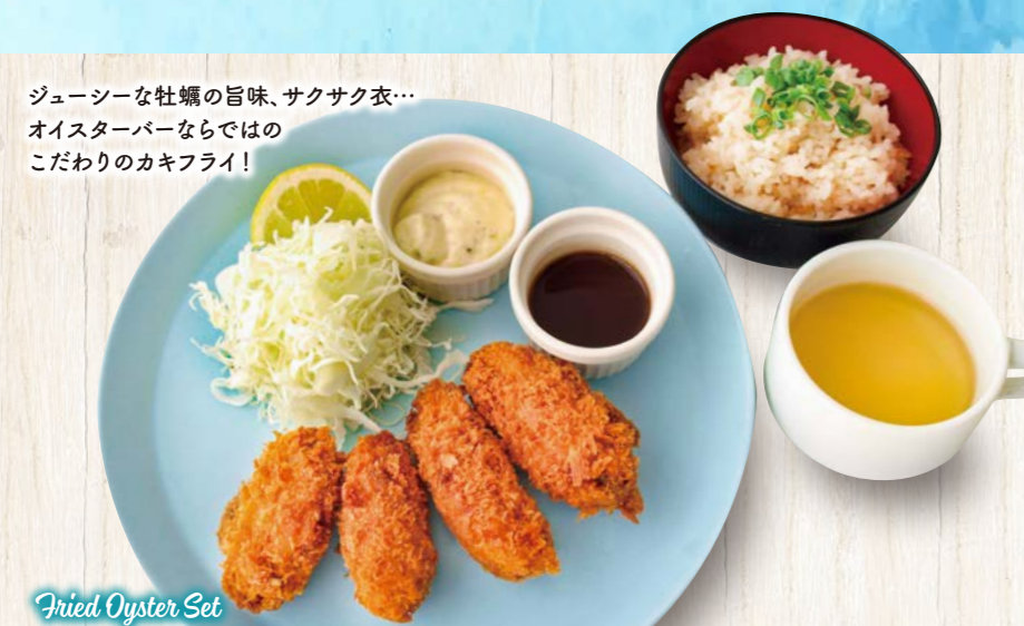
Fried Oyster Set

ジューシーな牡蠣の旨味、サクサク衣... オイスターバーならではの こだわりのカキフライ!