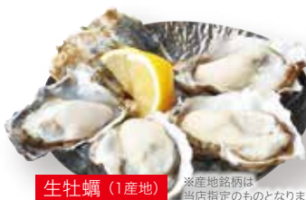
生牡蠣 (1産地) ※産地銘柄は当店指定のものとなります。