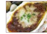
オニオングラタン焼き