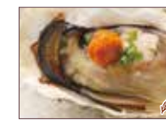
ウニと牡蠣醤油焼き