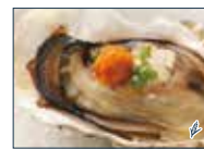
ウニと牡蠣醤油焼き