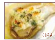
ガーリックバターソースと香草パン粉の焼き牡蠣