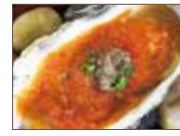
アンチョビトマト焼き