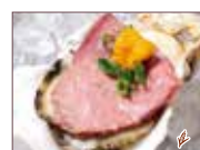
ローストビーフとウニ