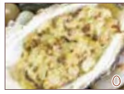
トリュフタルタル焼き